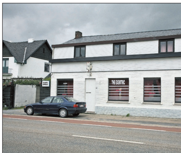
Klanten van The Exentric stapten zelf naar de politie om de mistoestanden aan te klagen.